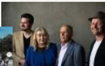
Albuma "Pašu auklētie" mūzikas autori

Thursday, October 3, 7 PM National Library of Latvia, Ziedonis Hall