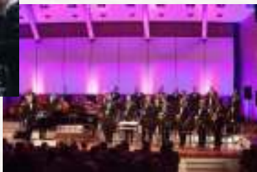
Orķestra "Rīga" bigbends