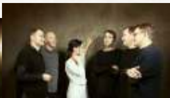
Tango Sin Quinto

Wednesday, April 1, 7 PM Great Guild Concert Hall