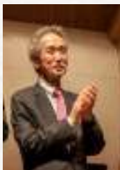
komponists Tošio Mašima

Biļetes „Biļešu paradīzes” kasēs www.bilesuparadize.lv